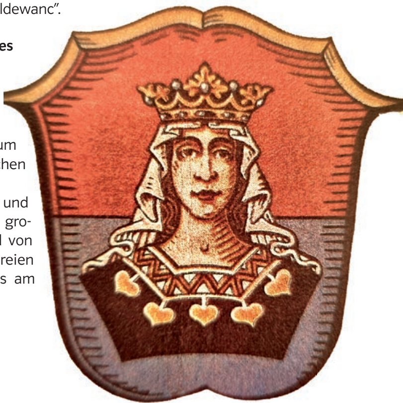
Königin Hildegard (Wappen des Altlandkreises Kempten)

In der Stadt Kempten erinnern der Hildegardplatz und das Hildegardis-Gymnasium mit Brunnen an die große Gönnerin. Des Weiteren ist Königin Hildegard von namhaften Künstlern in Decken- und Wandmalereien (Basilika St. Lorenz, Festsaal Residenz, Landhaus am Hildegardplatz) gewürdigt worden.